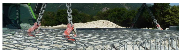
Gabion levable avec 2 crochets intégrés