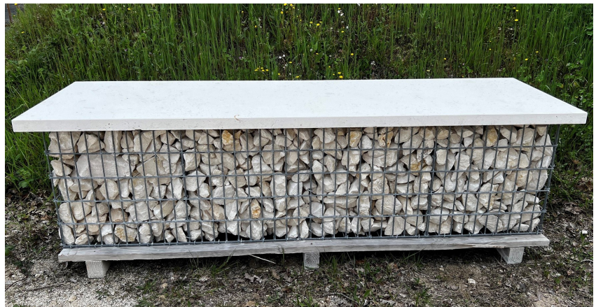
Banc gabion 2mx0.5x0.5

Panneaux crochets intégrés pour le levage